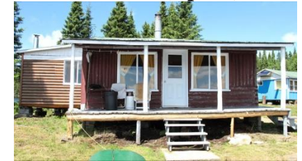
Chalet #4 (4 pers.)