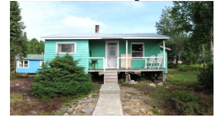
Chalet #3 (8 pers.)