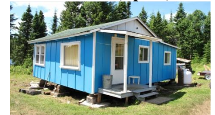
Chalet #7 (6 pers.)