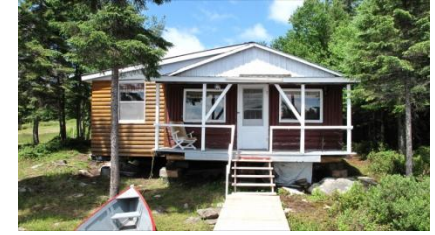
Chalet #2 (6 pers.)